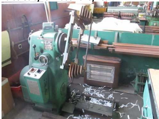
Ad 93 Stroj za izradu zavojnica