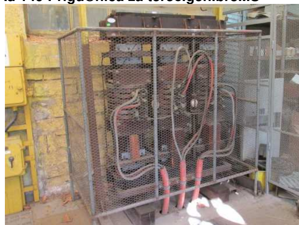
Ad 149 Prigučnica za tereć.gen.br3MS