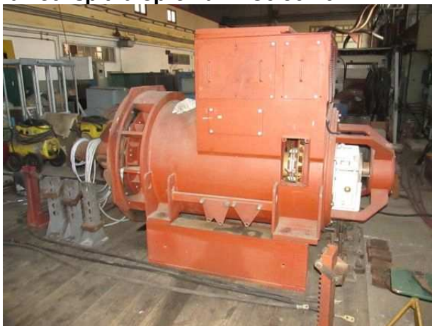
Ad 480 Ispitna oprema TNC6 567-6