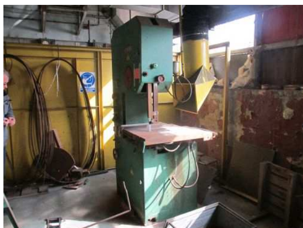
Ad 112 Vertikalna tračna pila