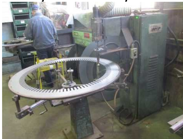
Ad 80 Stroj za točno zavarivanje TA 40