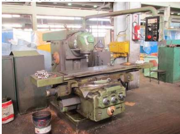
Ad 531 Glodalica univerzalna