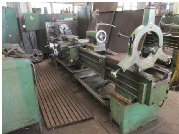
Ad 122 Tokarilica TPD 530/2500