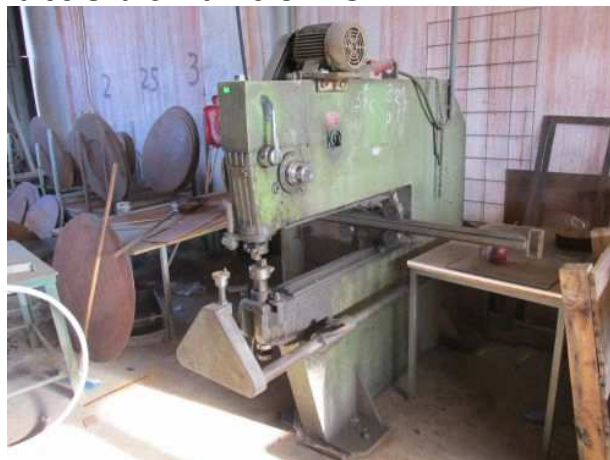
Ad 98 Škare kružne OMES