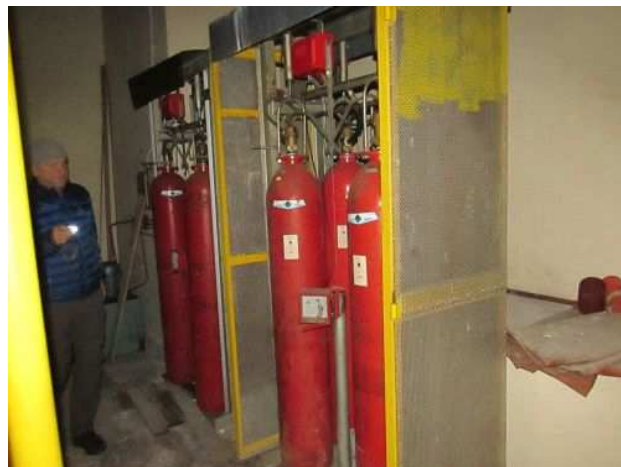
Ad 192 Sušara EL.3 SC 200/180-350 C