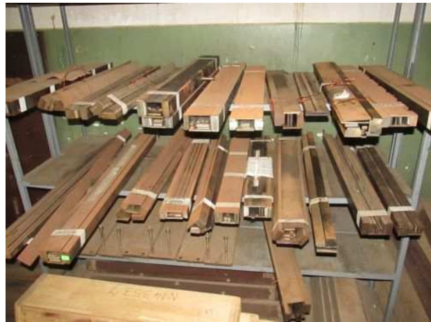
Ad 178 Stroj za nam.rotora u kompletu sa pomoćnim čeličnim kalupima