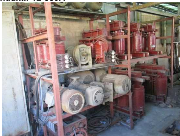
Ad 57 i 214 Transformator trof. 1600-12 i Teret induct.I-12-380A