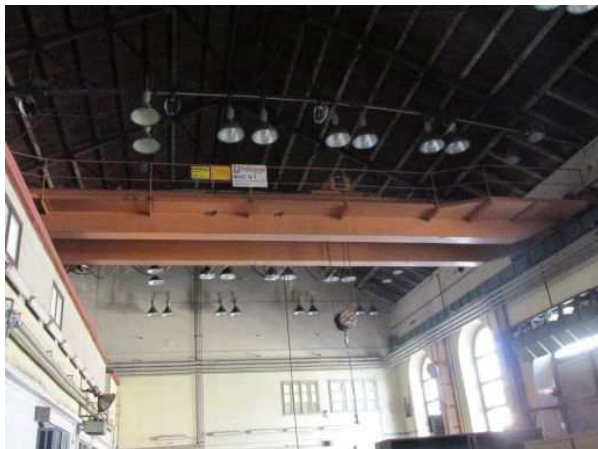
Ad 111 Dizalica mosna 160 KN