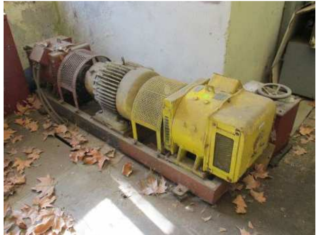
Ad 3, 5 i 6 Motor i generator pretv.grupe br.8. M.S.