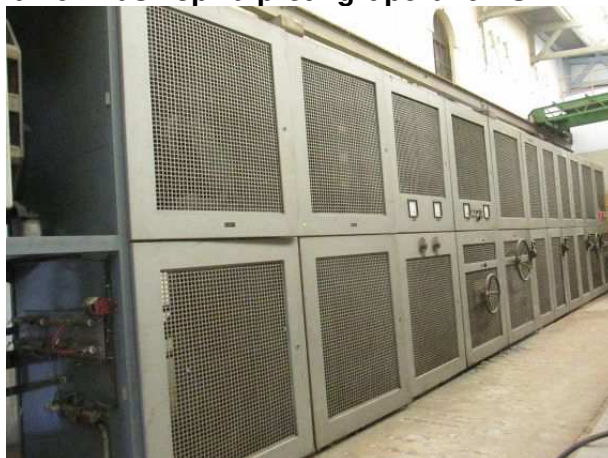
Ad 161 Rasklop.za pretv.grupe br.6 VS