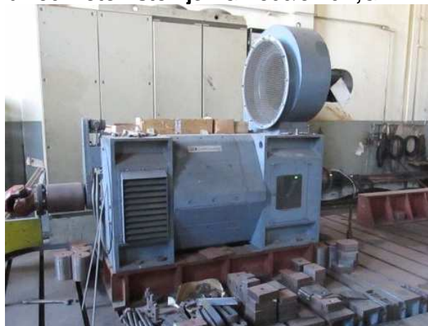
Ad 156 Motor istomje.FGE 500/57-6K,GL