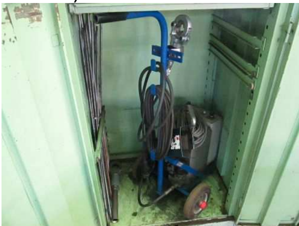
Ad 246 Preša hidraulična KLAUKE (KAB.STOP)