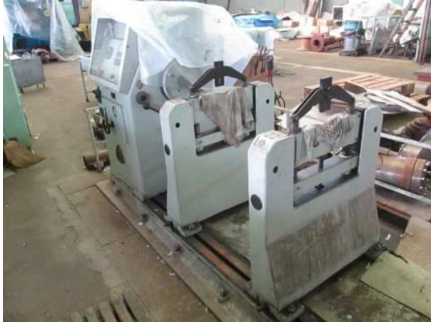
Ad 16 i 46 Stroj za balansiranje motora i Stroj za balansiranje