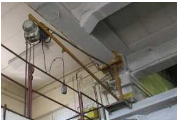
Ad 77 Dizalica el. MINOR 500/5