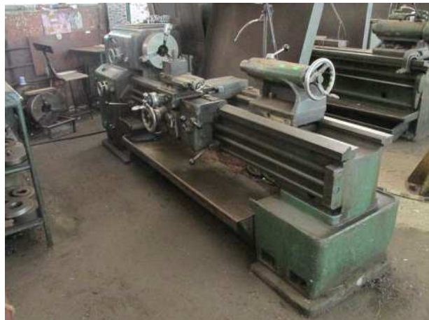
Ad 88 Tokarilica PA-B 25/1500