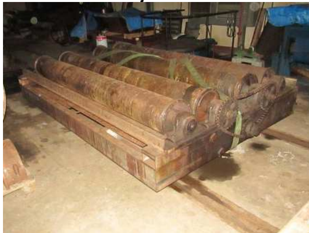
Ad 196 Kolica sa valjcima