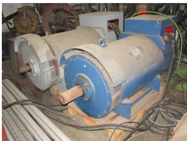
Ad 811 Generator tip S3 4014 B3/B5 K1106