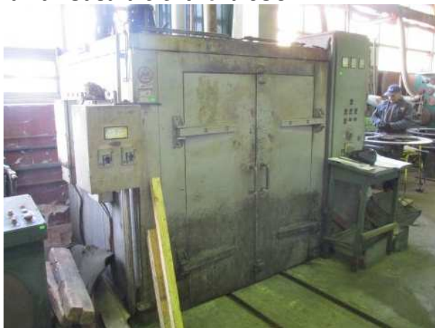
Ad 107 Sušara električna 3SC