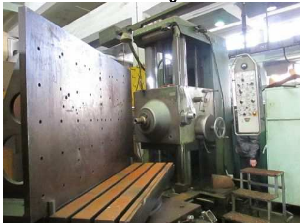
Ad 183 Bušilica horizont-glodalica