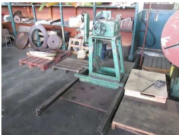
Ad 42 Stroj hydr.za preš.izolacije