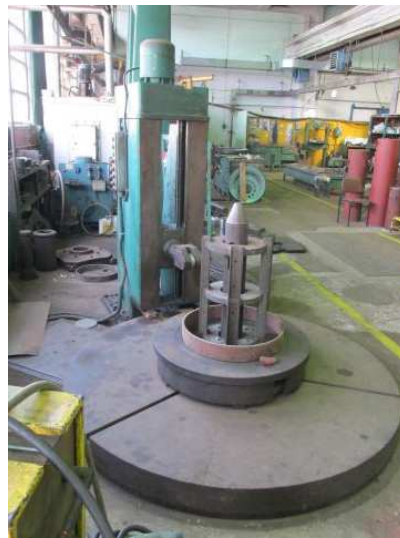
Ad 61 Preša hidraulična velika