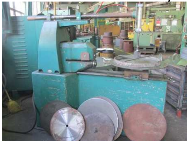
Ad 2 Škare kružne za lim - kružno rezanje