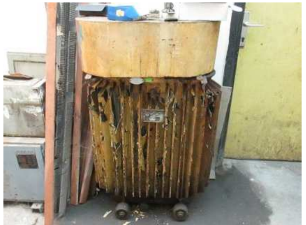
Ad 10 Transformator 100KVA br.10.M.S