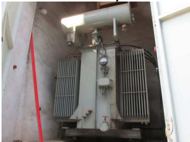
Ad 58 Transformator trof.uljn.10/6KV