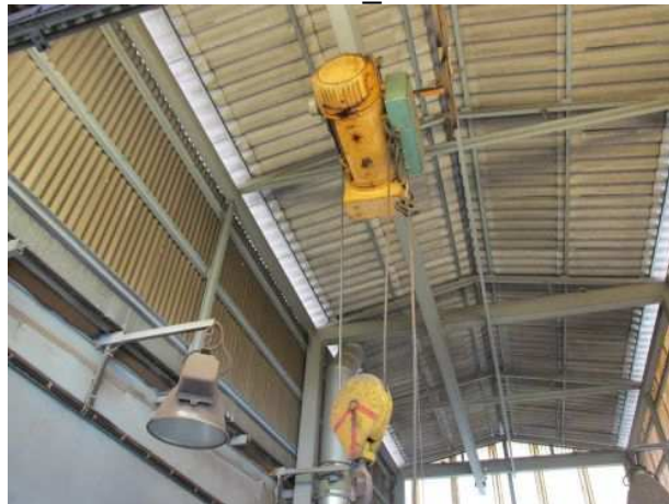
Ad 669 Dizalica mostna _T