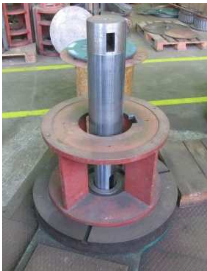
Ad 60 Preša hidraulična mala