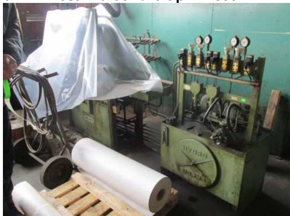
Ad 217 Preša hidraulična tip MP 300