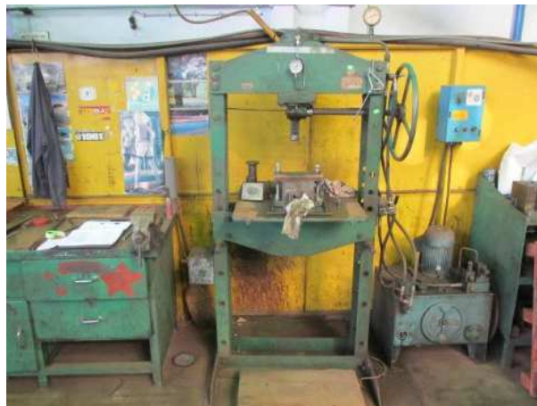
Ad 9 Preša hidraulična 500 mm