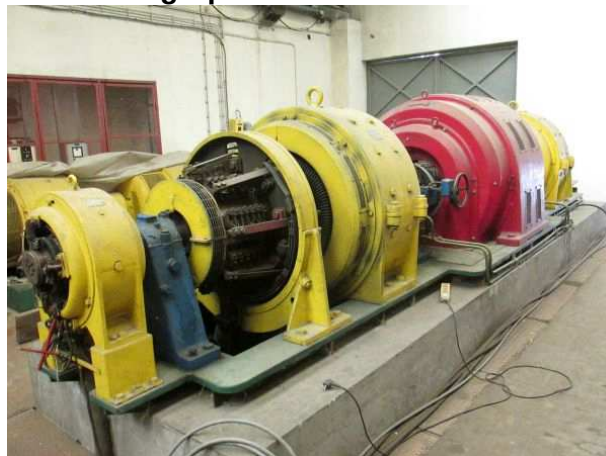
Ad 37 Pretv.grupa OERLIKON br.4.V.S.