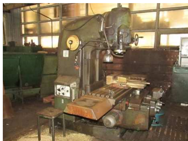
Ad 658 Glodalica univerzalna