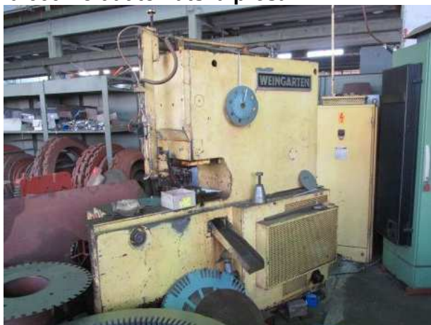
Ad 660 Poluautomatska preša-NK7