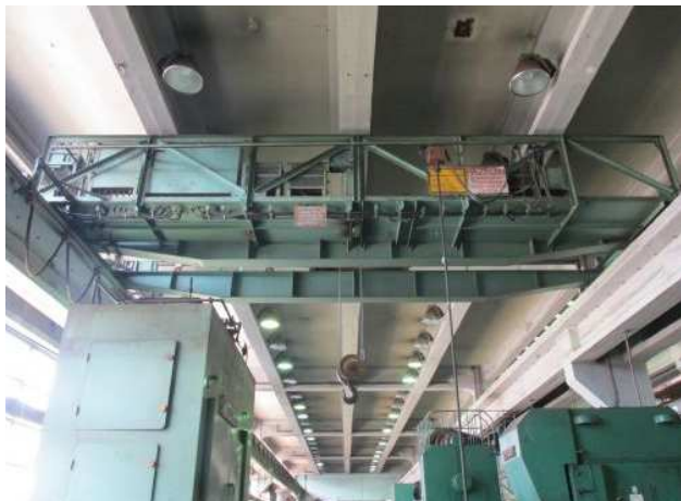
Ad 29 Dizalica mostna