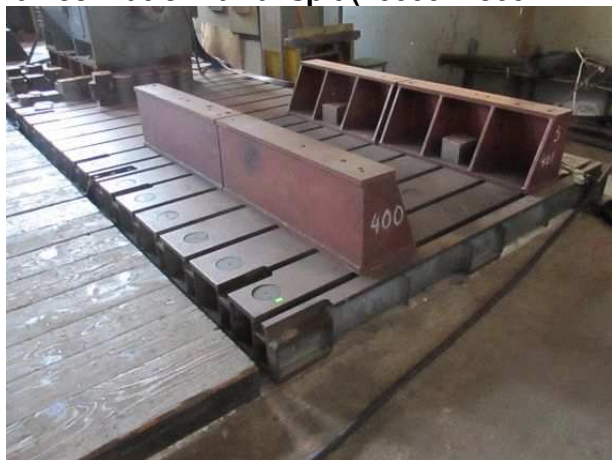
Ad 153 Platforma za ispit.(10000X2500