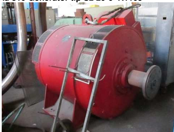
Ad 810 Generator tip S2 20-6 K1105