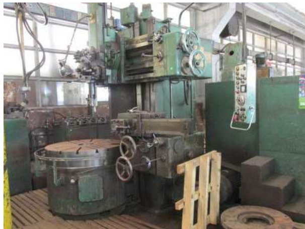
Ad 84 Tokarilica vertikalna (KARUSEL) KNA110