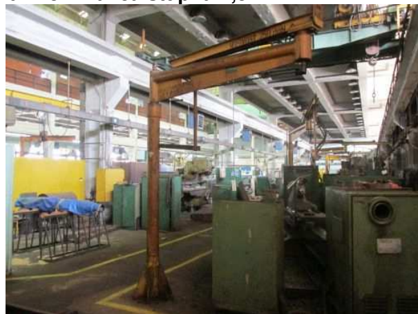
Ad 115 Dizalica stupna 2,5 KN