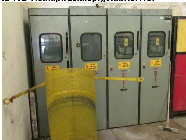
Ad 162 Vis.nap.rask.isp.gen.br.8.V.S.