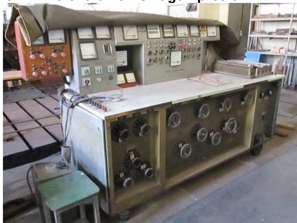
Ad 171 Pult za dinamo vagu i pretvar.