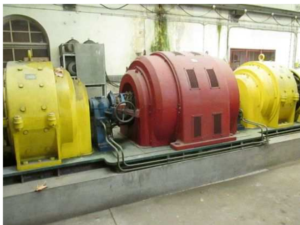
Ad 38 pretv.grupa OERLIKON br.5.V.S.