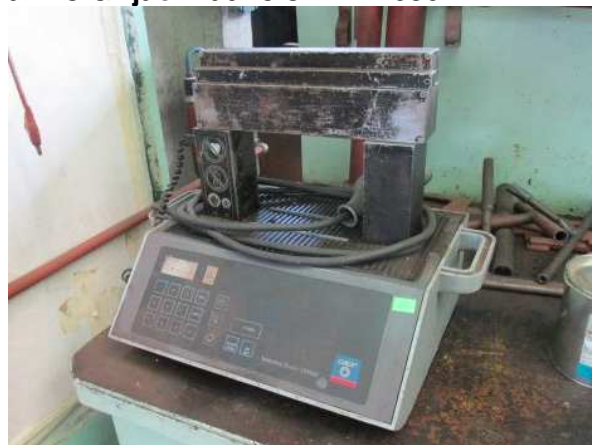
Ad 218 Grijač indukcioni TIH 050