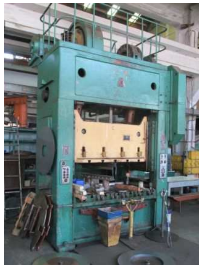
Ad 25 Preša dvostruka ekscent 160 t