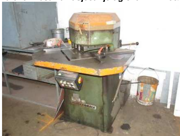
Ad 545 Preša za zasjecanje uglova EHN 260/