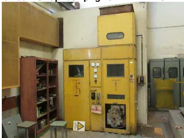
Ad 160 Vis.nap.rask.pr.gr.OERL.BR.7VS