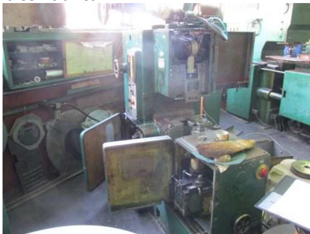
Ad 83 Dubilica X 7