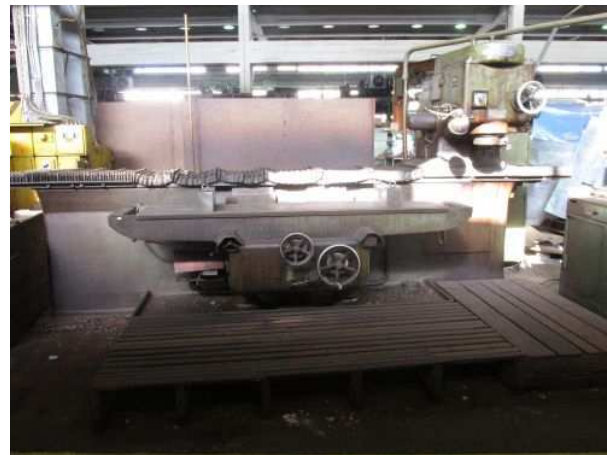
Ad 185 Glodalica NF 4V-BUSCH