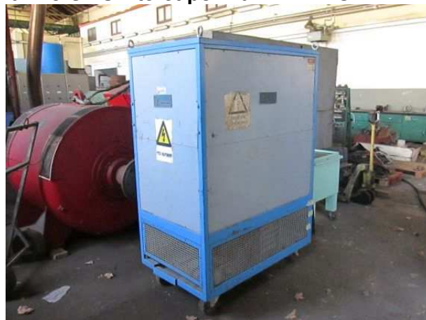
Ad 145 Omski teret pokr.br 4 AVTRON