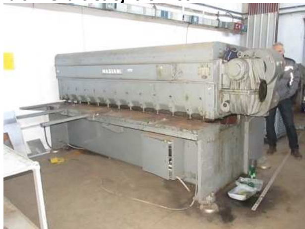
Ad 544 Škare strojne CIN-301