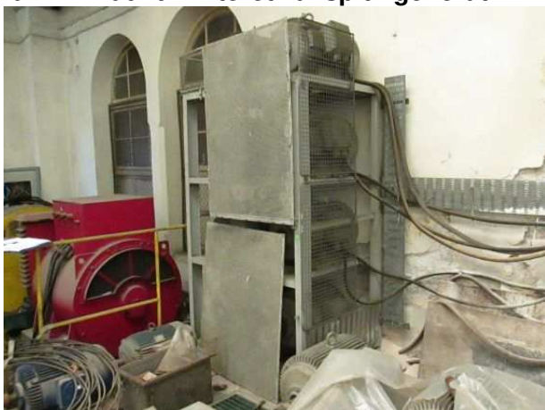
Ad 272 Induktivni teret za ispiti. generat