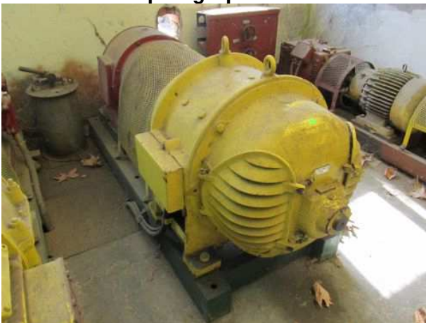
Ad 7 Generator pret.grupe br.7.M.S.