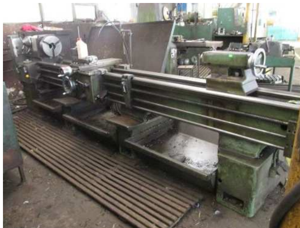
Ad 71 Tokarilica univerzal 48S/3000