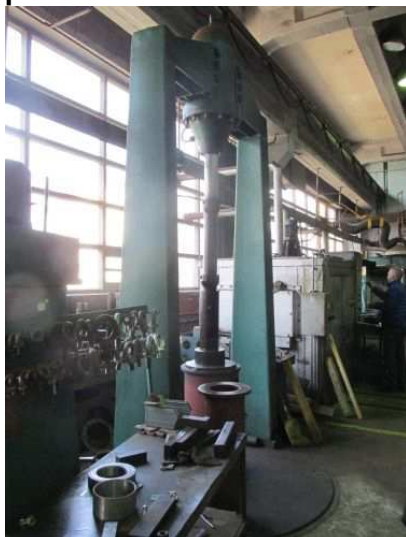
Ad 11 Hidraulična stubna preša