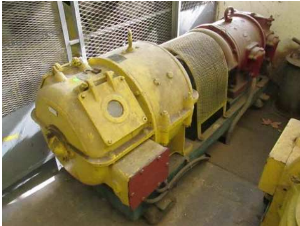
Ad 1 Motor pretv.grupe br.6. M.S.