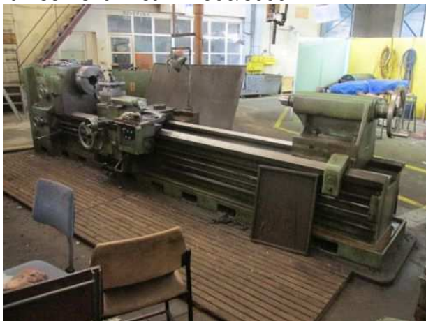
Ad 133 Tokarilica PA 900/3000