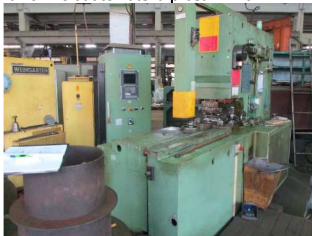
Ad 457 Poluautomatska preša-NK16