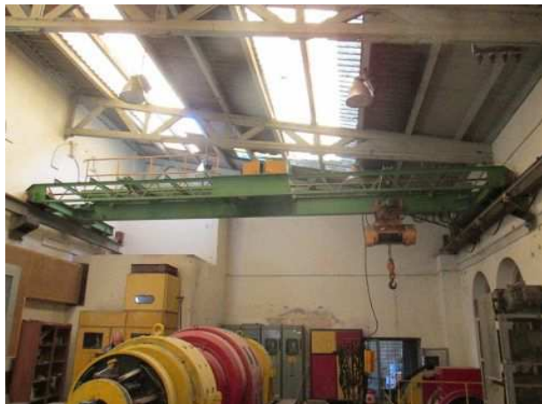
Ad 21 Dizalica mostna 30 KN V.S.