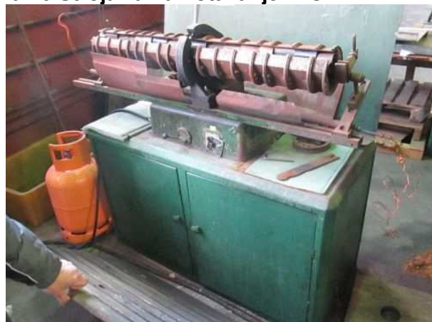
Ad 40 Stroja za namotavanje MICAFIL