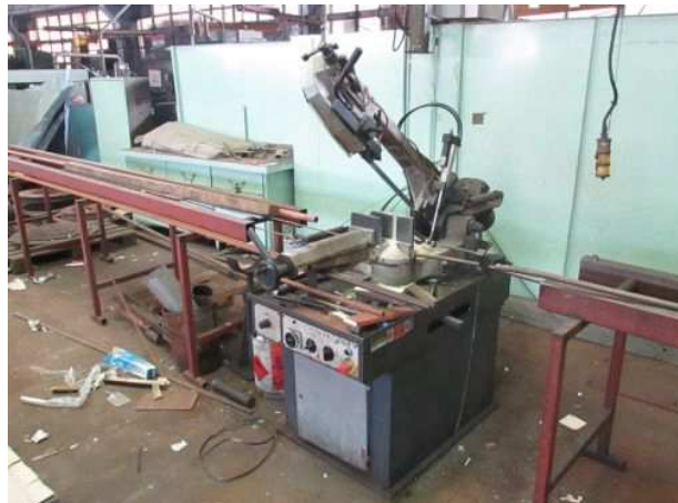
Ad 546 Pila tračna - horizontalna 315 CSO