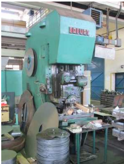
Ad 59 Preša 250 t excentar - ERFURT