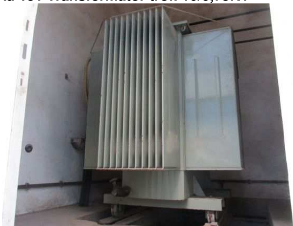
Ad 151 Transformator trof. 10/0,75KV