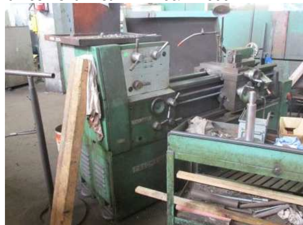
Ad 109 Tokarilica TNP-160/B-1000