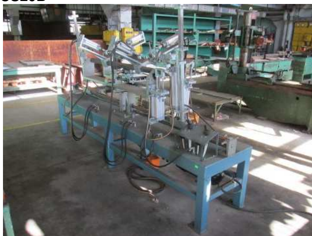
Ad 520 Stroj za oblikovanje svitaka namota CS20B