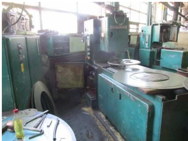
Ad 70 Dubilica X-15 štanc mašina