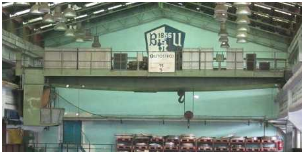
Ad 33 Dizalica mostna 15t