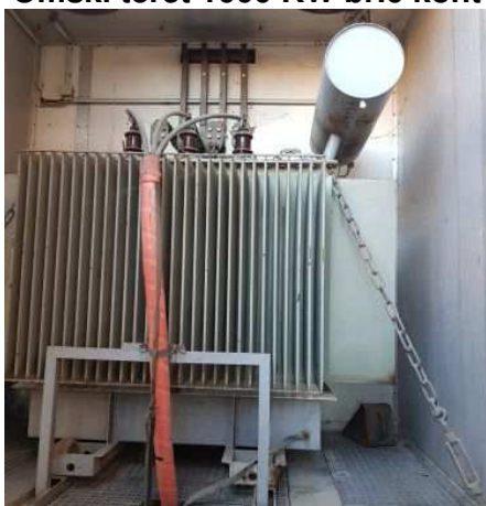
Ad 147 Omski teret 1000 KW br.6 kont