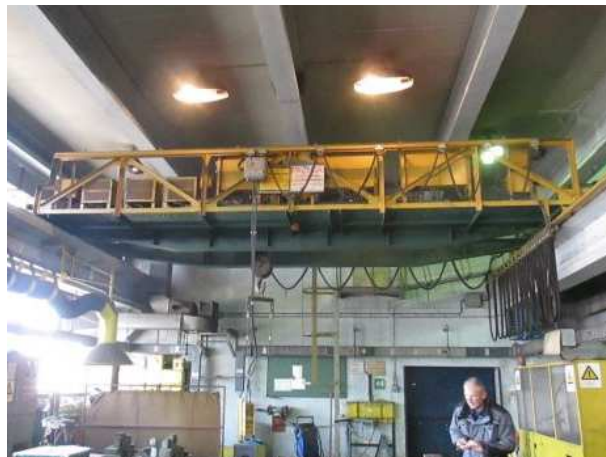
Ad 27 Dizalica mostna 5t