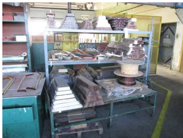
Ad 43 i 44 Stroj za namotav izol trake