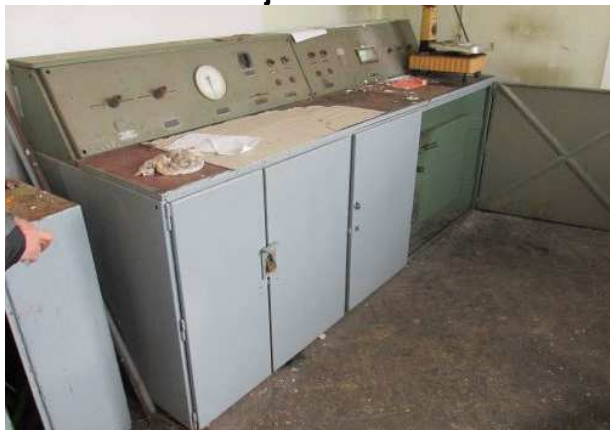
Ad 20 Peć za sušenje