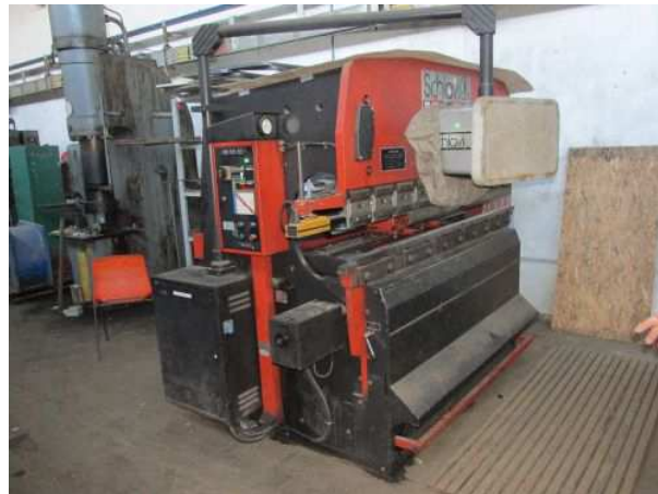
Ad 547 Preša APKANT RG 50/20