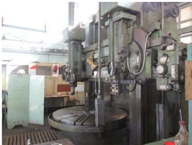
Ad 62 Tokarilica vertikalna (KARUSEL) DKZ 2000