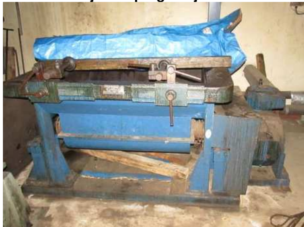
Ad 195 Uređaj za impregnaciju statora