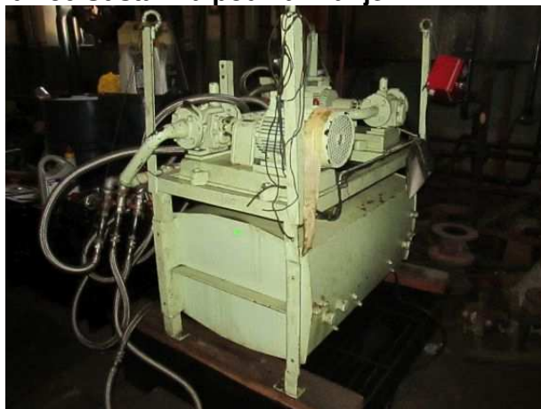
Ad 486 Sustav za podmazivanje