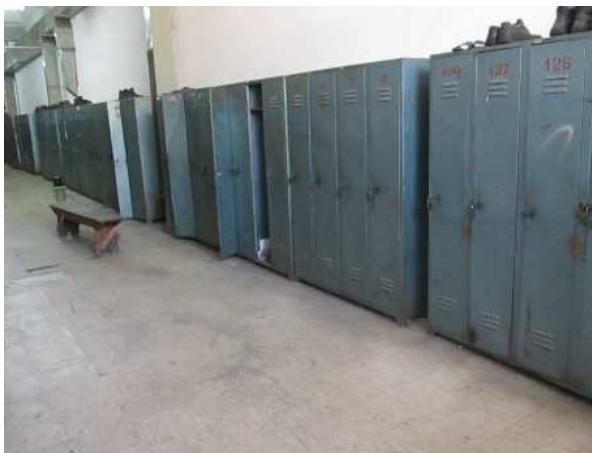
Ad 278 ÷ 310 Ormar garderobni limeni