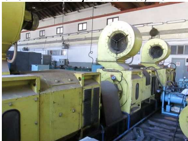
Ad 157 Motor istomjer. G450 H400,BBC