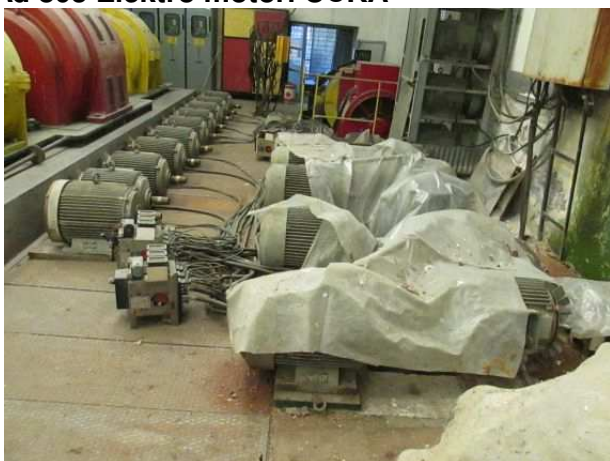
Ad 803 Elektro motori UČKA