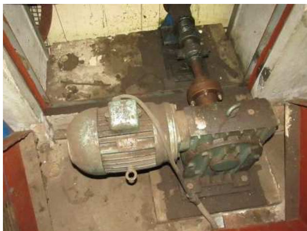
Ad 201 Reduktor - pogon valjaka