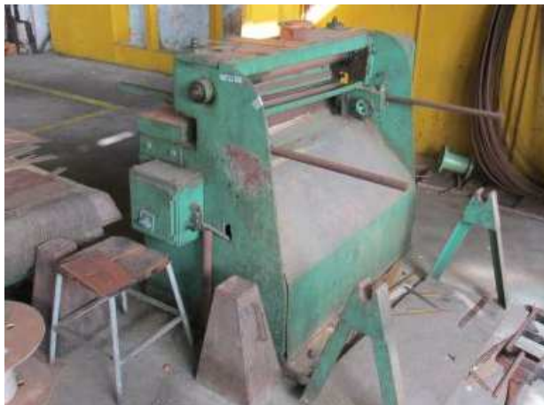
Ad 19 Škare motorne