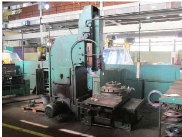
Ad 85 Blanjalica vertikal 73430