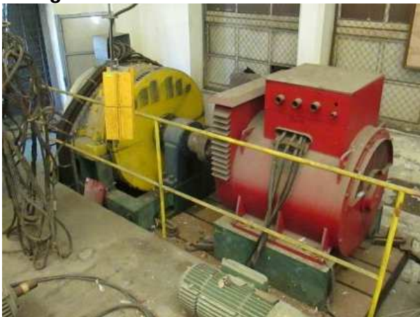
Ad 12 i 143 Motor pretv.grupe br.1. V.S. i Pretv.gr.MARKO-RUS BR.1.V.S.