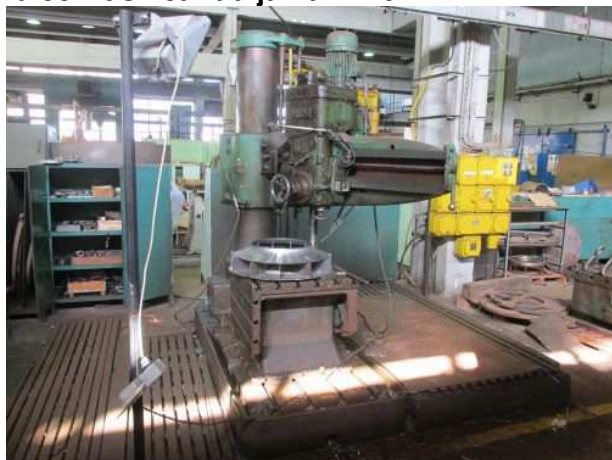
Ad 95 Bušilica radijalna VR 6 AB