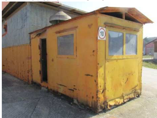
Ad 177 Kućica za KALAI SANJE