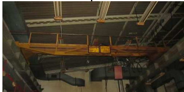
Ad 45 Dizalica mosna pneumatska