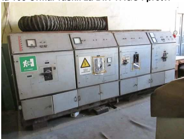
Ad 168 Ormar raskl. za DIN VAGU i pretv.