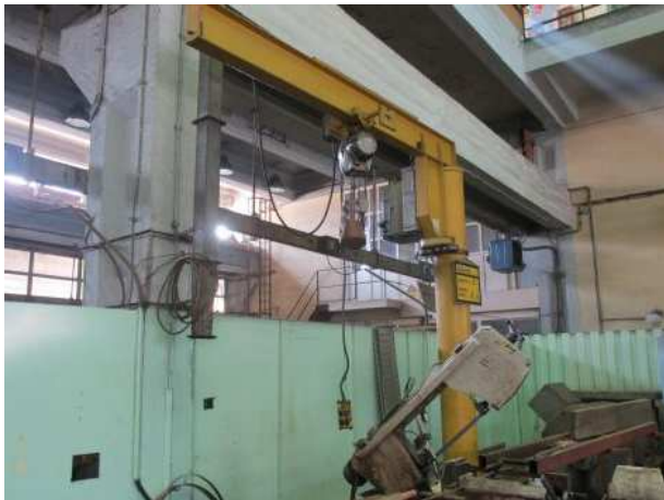
Ad 667 Dizalica