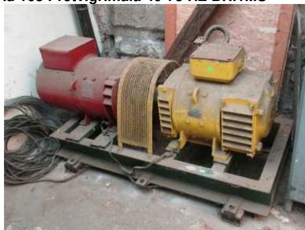
Ad 163 Pretv.gr.mala 40-75 HZ BR.1MS