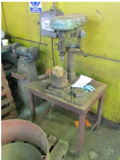
Ad 22 Bušilica stolna