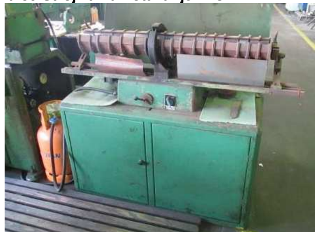
Ad 39 Stroj za namotavanje MICAFIL