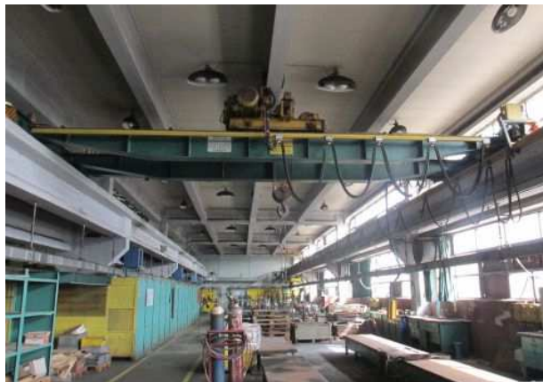
Ad 28 Dizalica mostna 5t