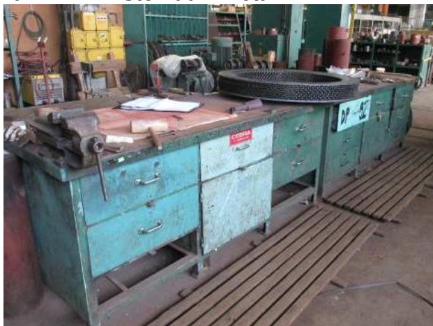
Ad 421 i 422 Stol radni metalni